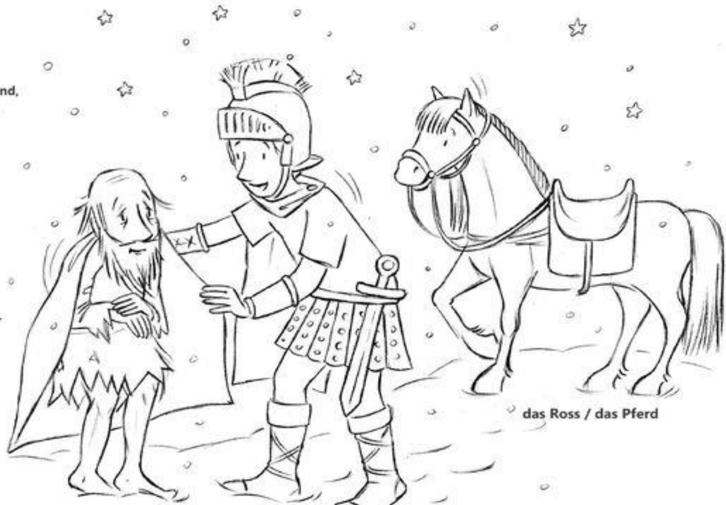
der arme Mann

Sankt Martin, Sankt Martin, Sankt Martin zieht die Zügel an, sein Ross steht still beim braven Mann. Sankt Martin mit dem Schwerte teilt den warmen Mantel unverweilt.